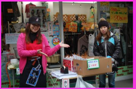
子供に人気！イタリアンポッキー 大人に人気！もち煮込み 『笹舟』