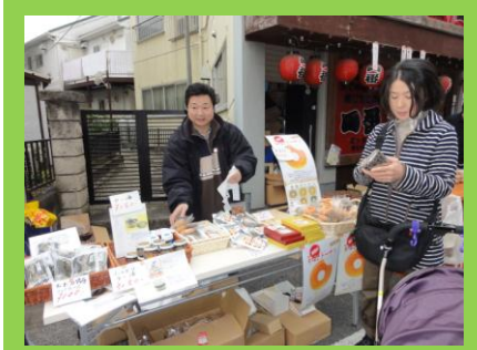
はやりのラー油も！ 『青木企画』

こいわしょうわどお ようこそ、小岩昭和通りへ！ なごみいちしゅってん 和市出店 36組！ (大人94名・子供19名参加)