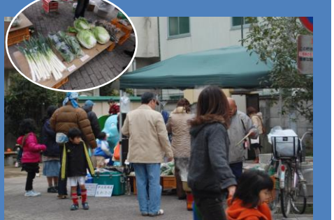
初参戦！自然野菜 『ミッキー』